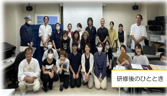
研修後のひととき

木を構成しているパーツ(根や幹、枝葉)ごとに、 項目を設け、 (課題やご本人の想い、ご本人の役割など) 様々な角度から意見出しを行いました。